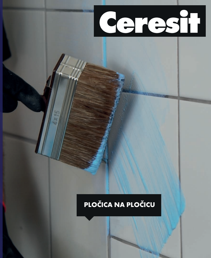
PLOČICA NA PLOČICU

CN 94 je specijalni osnovni premaz za pouzdano izlivanje masa za nivelisanje, lepljenje keramike i prirodnog kamena na sve tipove podloga.